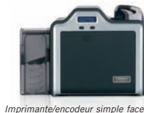
Imprimante/encodeur simple face