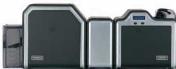
Option de laminage et imprimante/encodeur double face