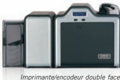
Imprimante/encodeur double face