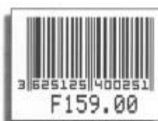
Etiquettes imprimées par la 6020