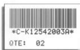
Etiquettes imprimées par la 6021