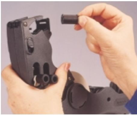
Sauberer und schneller Farbrollenwechsel durch patentierten Schnappverschluss