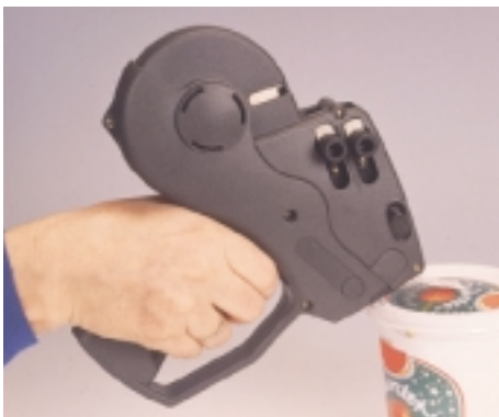
Ergonomische Features für leichtes Handling und hohe Produktivität

Tech. Änderungen im Sinne der Produktverbesserung vorbehalten.