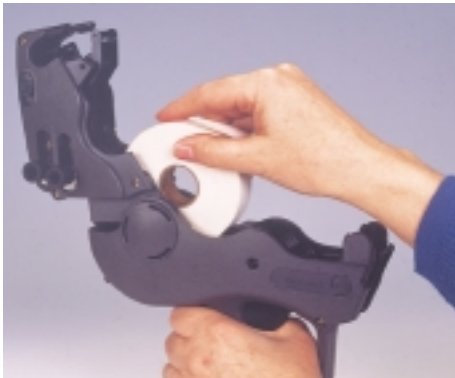
Ultraleichter Etikettenwechsel durch einfaches Aufklappen der Maschine